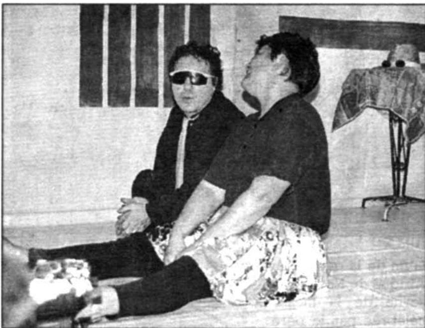
Hippo, l'amoureux de Julie-Berthe lui assure être le vrai Billy-Ze-Kick pour lui plaire.

« Billy-Ze-Kick » est joué ce soir à 21 heures, demain à 21 heures et dimanche à 17 heures, au 2 rue de Nervaise à Tracy-le-Mont.