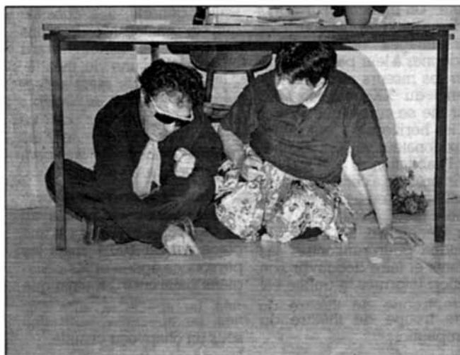
« Billy ze Kick » se jouera à Cambronne-les-Ribécourt le 13 février à 20 h 30.